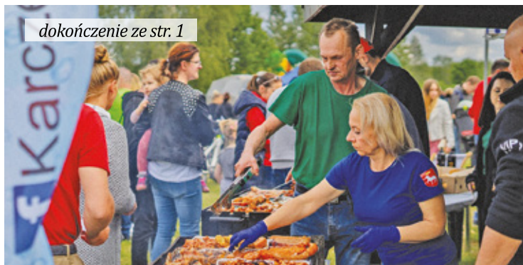
dokończenie ze str. 1

Na uczestników czeka wiele przysmaków i słodkości