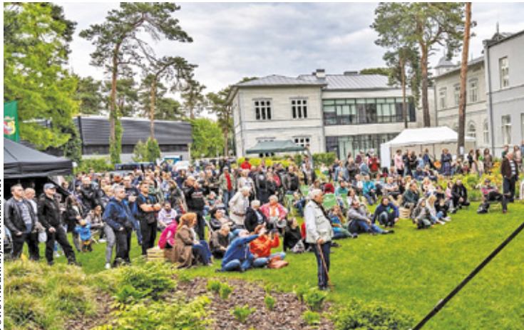
Podczas festiwalu przeniesiesz się w czasie do magicznego świata przedwojennej Polski

Na kilkudniowy Festiwal Świdermajerów, organizowany przez Towarzystwo Przyjaciół Otwocka, czeka mnóstwo osób. To coroczne wydarzenie cykliczne ma na celu popularyzację dziedzictwa kulturowego linii otwockiej oraz przedstawienie przedwojennej architektury drewnianej w tzw. stylu świdermajer. Festiwal od samego początku zyskał dużą popularność i stał się stałym punktem w kalendarzu wydarzeń kulturalnych Otwocka. Podczas 10. edycji Festiwalu, który odbędzie się w dniach od 16 do 25 czerwca, na uczestników czeka bogaty program m.in. koncerty, wystawy oraz ciekawe eventy, które przeniosą uczestników w przedwojenną i fascynującą przeszłość Otwocka. Przedstawiamy kilka