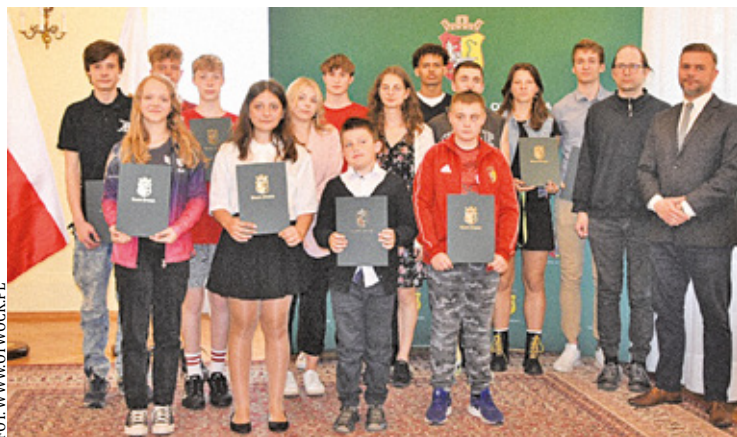
Stypendyści z Otwocka

Prezydent i Rada Miasta Otwocka wspierają dzieci oraz młodzież, które są uzdolnione sportowo. Wraz z tym są między innymi przyznawane stypendia dla zawodników trenujących na co dzień w otwockich klubach. Tego rodzaju wyróżnienie otrzymują również dorośli sportowcy,