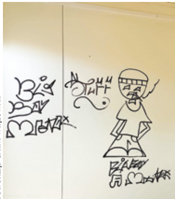
Malunki na ścianie toalety w gminnym parku

Kilka dni temu w gminnym parku przy ul. Lubelskiej doszło do aktów wandalizmu w damskiej toalecie. Sprawcy wykazali się, malując dziwne rysunki i bazgroły na ścianach. Dzięki monitoringowi udało się ustalić tożsamość wandalów. Okazało się, że za tymi