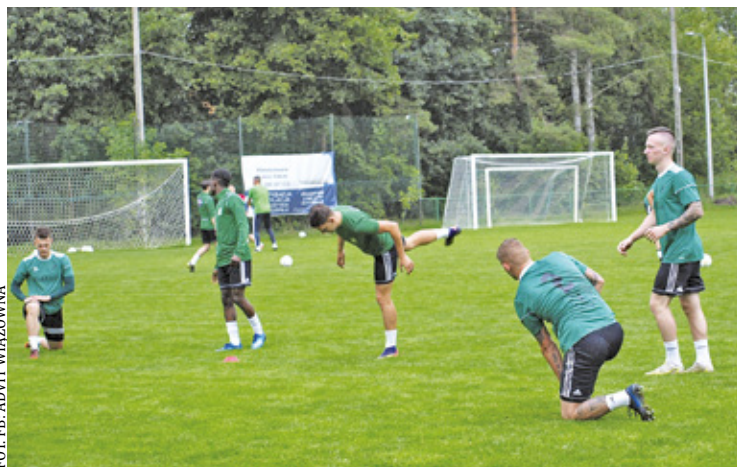
Advit Wiazownna wygrywa kolejny mecz

Pierwszą połowę wyjazdowego starcia z Vulcanem Wólka Mładzka cechowała twarda gra i dużo walki z obu stron. Ostatecznie kibice nie obejrżeli w niej bramek, natomiast goli nie brakowało po przerwie. W 54. minucie po zamieszaniu w polu karnym gospodar-