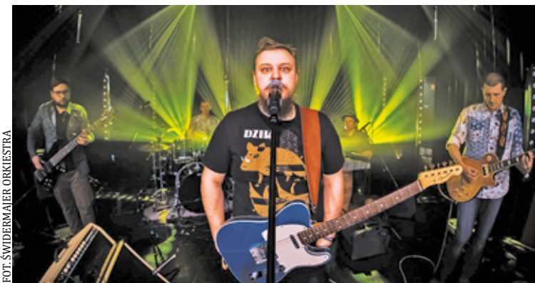
Festiwal otworzy koncert w Klubokawiarni Stacja Falenica

informuje, iż w siedzibie Urzędu Gminy w Celestynowie, przy ul. Reguckiej 3, został podany do publicznej wiadomości na okres 21 dni wykaz nr 5/2023 dotyczący nieruchomości gruntowej, położonej w miejscowości Stara Wieś, stanowiącej własność Gminy Celestynów, przeznaczonej do oddania w dzierżawę na czas określony.