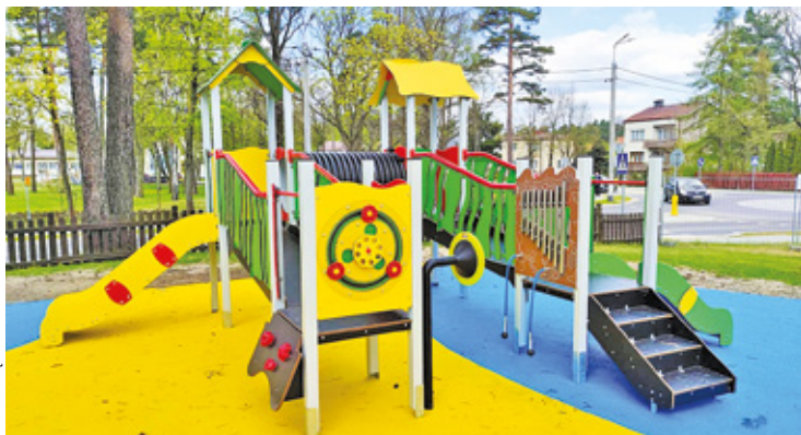
W ramach modernizacji placu zabaw wymieniono urządzenia zabawowe

W ramach modernizacji pojawiły się nowe zestawy zabawowe, takie jak huśtawki pojedyncze i podwójne, tyrolka, zabawki sensoryczne oraz koparka dla małych budowniczych i linarium dla starszych dzieci. Jednak to nie wszystko, bo pojawiły się także