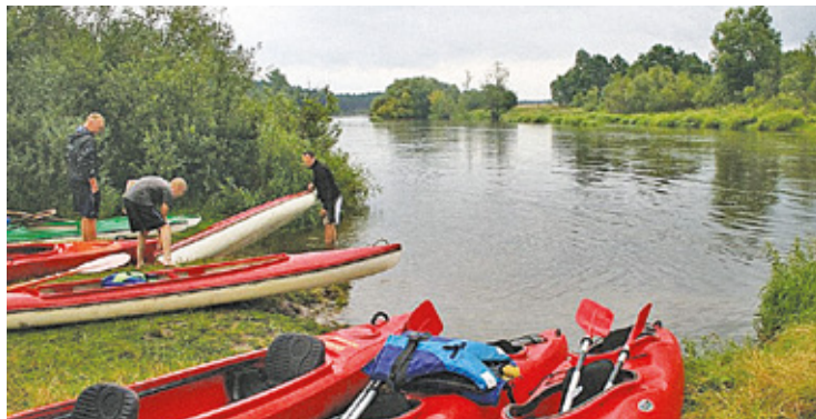
Jeden ze świadków wezwał na pomoc policję

Na miejscu zdarzenia funkcjonariusze błyskawicznie interweniowali. Policjanci zauważyli przy brzegu rzeki wysiadające z kajaka dwie osoby. Kobieta miała na rękach dziecko. Para była zszokowana interwencją stróżów prawa – podkreśla rzeczniczka prasowa KPP Otwock. I dodaje, że zachowanie mężczyzny i jego partnerki jednoznacznie wskazywało, że są pod wpływem alkoholu.