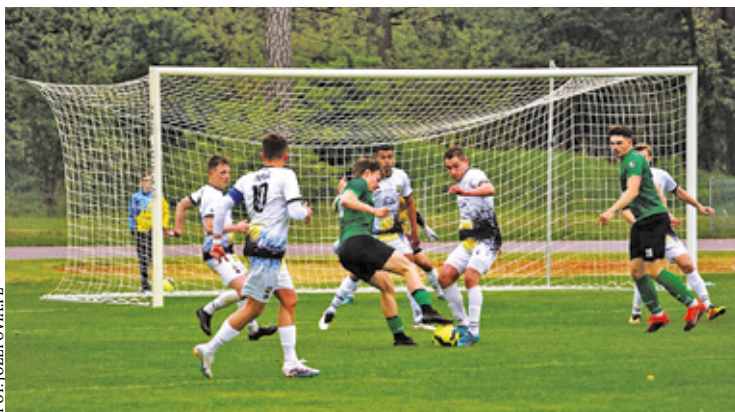
Niesamowita seria Józefovii Józefów