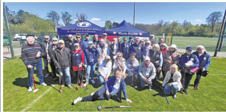
Majówkowy turniej ground golfa w Józefowie

– Ground Golf jest grą w czasie, przy której możesz się dobrze bawić, nie będąc mistrzem gry. To jest gra, która zapewnia radość ludziom w różnym wieku od wnuków do dziadków. Ma wszystko, czego potrzeba, aby być radosną, rodzinną rozrywką – czytamy na stronie internetowej topgolf.pl.