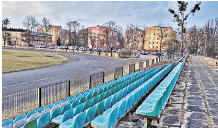
Kompleks basenowy powstanie na dużym terenie u zbiegu ul. Karczewskiej i ul. Ślusarskiego

Pod koniec kwietnia w Teatrze Miejskim w Otwocku Jarosław Margielski, prezydent Otwocka podpisał umowę z wykonawcą na budowę kompleksu basenowego przy ul. Karczewskiej. – To drugi co do wielkości po „wielkiej dziurze” symbol marazmu, niespeł-