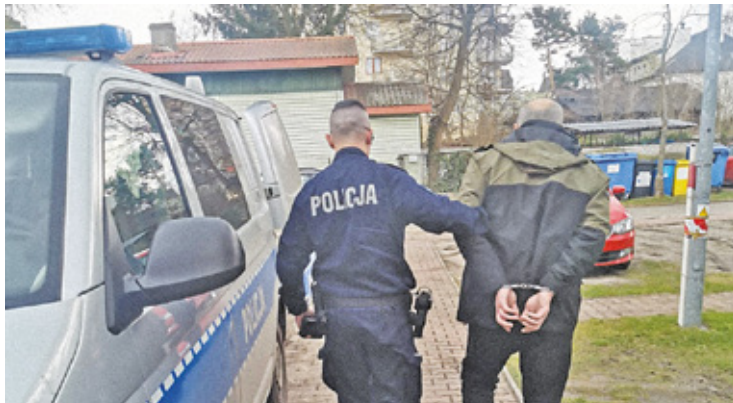
Policja zatrzymała sprawców