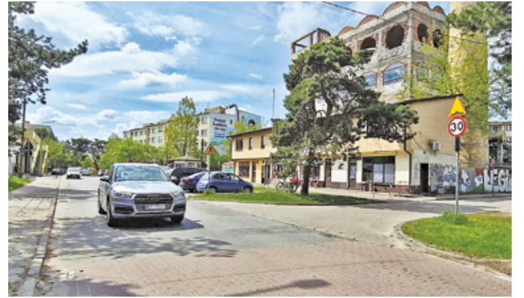
Ulica Sportowa to kolejna modernizowana droga w tej części miasta

Od strony ul. Sportowej i ul. Ślusarskiego – na terenie OKS – za 110 mln zł ma być budowany kompleks basenowy z szerokim zapleczem, w którym znajdzie się m.in. 8-torowy basen, basen