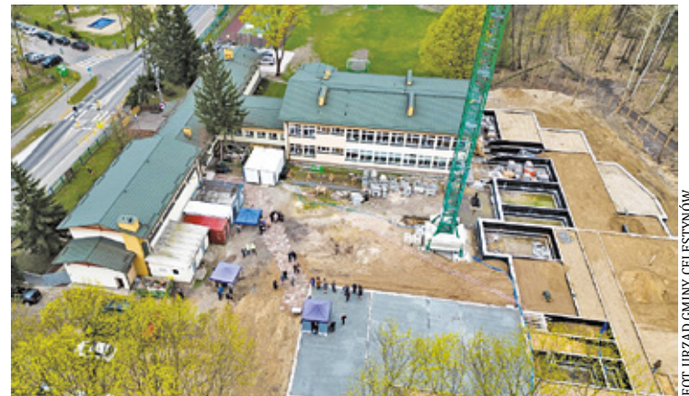
Rozbudowa szkoły w Starej Wsi poprawi jakość edukacji i zwiększy komfort nauki

– Rozbudowa szkoły obejmie skrzydło północne budynku, w którym na parterze i piętrze znajdują się nowe pomieszczenia, takie jak świetlica z zapleczem, stołówka, biblioteka z czytelnią, sale zajęciowe, gabinety specjalistów, węzły sanitarne oraz pomieszczenia administracyjne. Nowa część szkoły będzie posiadała dwie kondygnacje nadziemne, a powierzchnia użytkowa wyniesie ponad 3000 m kw. – tłumaczy urz. – W ramach rozbudowy szkoła zyska 5 oddziałów przedszkolnych, 2 oddziały dla 6-latków (zerówka), świetlicę dla klas 0-3, a także 8 sal dydaktycznych, salę ruchową, salę sensoryczną,