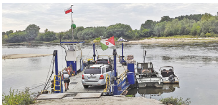
W ubiegłym roku funkcjonowanie promu stało pod znakiem zapytania

Przeprawa promowa to jedna z najstarszych form transportu wodnego, która do dziś cieszy się dużą popularnością w wielu regionach Polski. Jednym z takich miejsc jest prom, który pływa po Wiśle pomiędzy Karczewem (powiat otwocki) a Gassami (powiat piaseczyński). Przeprawa promowa nie tylko skraca drogę i pozwala uniknąć stania w długich korkach m.in. przed