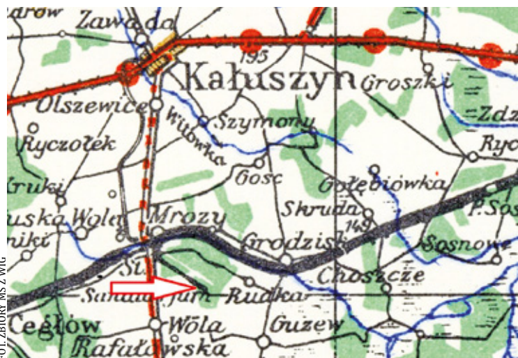
Wycinek mapy przedstawiający szlak od Witów przez Kałuszyn, Mrozy i Rudkę. Strzałka wskazuje czarną kreskę, która oznaczała trasę tramwaju konnego