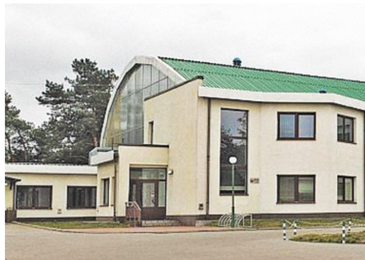
Niedługo za ponad 2,4 mln zł obiekt zostanie zmodernizowany

Niedawno zakończył się przetarg ogłoszony przez urząd (w marcu) na kompleksową modernizację budynku centrum kultury i sportu. Oferty złożyły