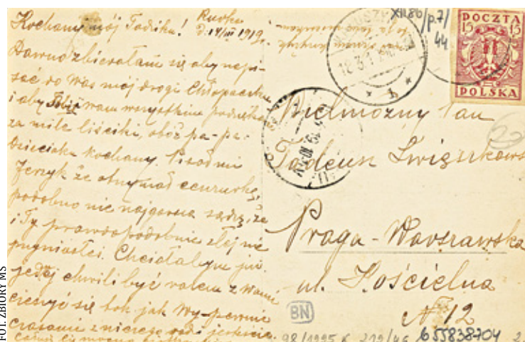
Rewers pocztówki wysłanej przez pacjentkę z sanatorium w Rudce

koronie na rewersie, czyli gratka dla filatelistów.