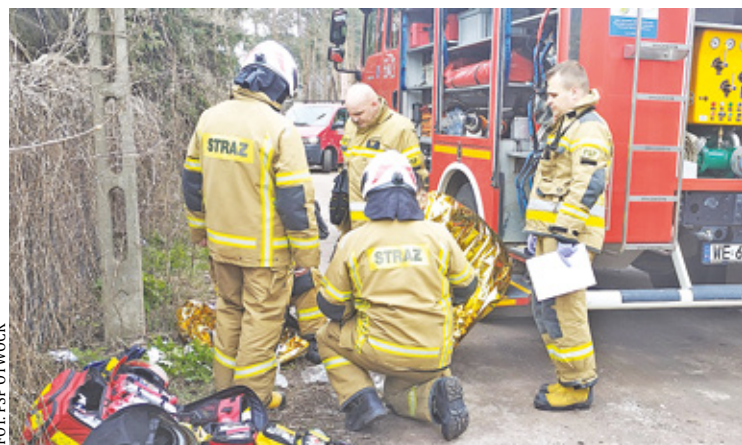
Strażacy udzielili pomocy poszkodowanemu nastolatkowi

uczeń technikum „Nukleonika” w Otwocku. Nastolatek za kilka tygodni będzie pisał maturę.