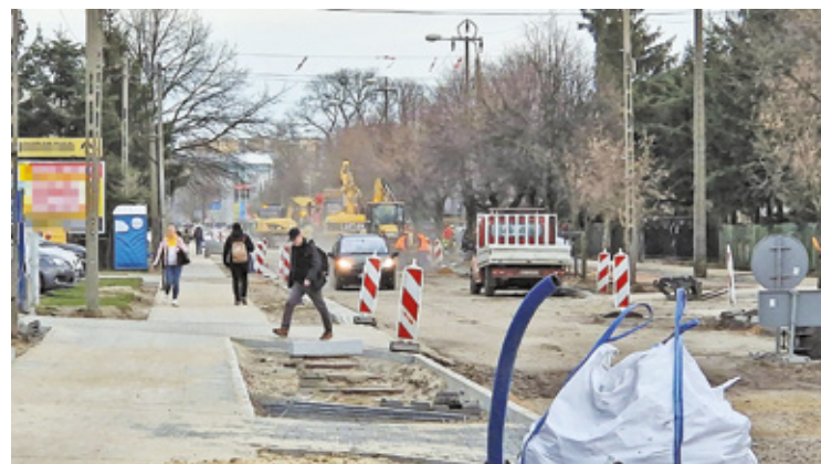
Od lutego trwa remont ul. Wawerskiej, gdzie budowane jest m.in. rondo i ścieżka rowerowa