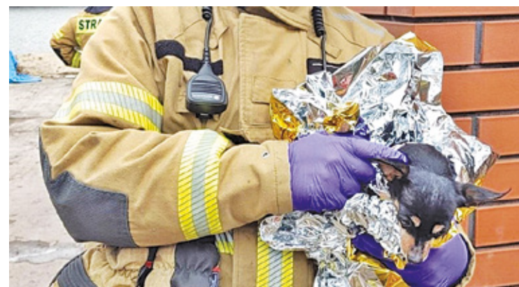
Podczas przeszukiwania budynku strażacy znaleźli małego pieska, który cudem przeżył

Żywioł udało się szybko opanować, ale w budynku było bardzo dużo dymu, dlatego Komendant Powiatowy PSP w Otwocku polecił zastosowanie specjalnego wentylatora. – Podczas przeszukiwania budynku strażacy znaleźli małego pieska, który cudem przeżył. Zwierzę było zatrute dymem. Strażacy ewakuowali czworonoga i podali mu tlen. Po kilku minutach pies wrócił do pełni sił – mówi strażak z PSP Otwock. I dodaje, że budynek został sprawdzony