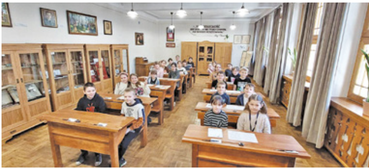
W sali Piłsudskich odbywają się ciekawe zajęcia z kaligrafii

Wydarzenie było tym bardziej wyjątkowe, że szkoła mogła pochwalić się zakończonym nowym i wyjątkowym projektem. W szkolnych murach odtworzono salę lekcyjną z dawnych czasów tj. okresu II Rzeczypospolitej. – To „Sala 100-lecia im. Aleksandry i Józefa Piłsudskich”, która swoim wyglądem nawiązuje do powstałej sto lat temu Szkoły Powszechnej w Willach Świderskich, mieszczącej się w świdermaje-