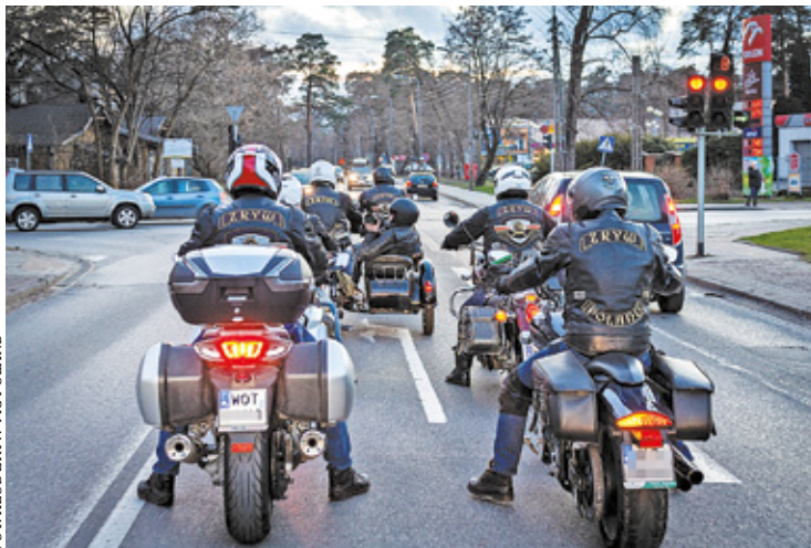
Na paradę motocykli czekają pasjonaci motoryzacji

Wiosna oznacza otwarcie sezonu motocyklowego. Z tej okazji imprezę dla miłośników jednośladów zorganizuje otwocki klub motocyklowy Zryw MC Poland, który istnieje od 1961 roku. Już w najbliższą sobotę, czyli 22 kwietnia, planują huczne obchody oznaczające, że nastąpiła już pora na wyprawę motorem przez kraj. Zanim jednak miłośnicy ryczących jednośladów wyjadą w dłuższe trasy, warto wziąć udział w paradzie motocyklowej ulicami Otwocka, którą zaplanowali organizatorzy (trasa będzie zbliżona do tej z poprzedniego roku).