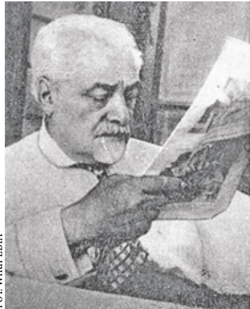
Dr Samuel Goldflam

Goldflam Warszawiak, syn kupca, uczeń warszawskiego gimnazjum i student Cesarskiego Uniwersytetu Warszawskiego pierwszą swoją pracę dostaje w szpitalu św. Ducha. To uświadamia mu, jak mało wie. Stąd wyjazd za granicę i studia w Paryżu i Berlinie. Po powrocie do Warszawy kontynuuje pracę naukową i szpitalną w poliklinice