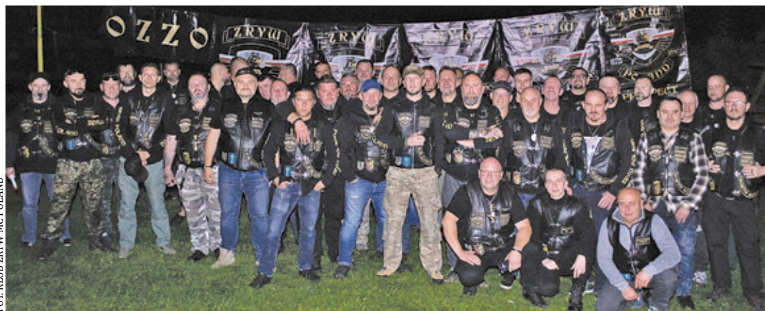
Otwocki klub motocyklowy istnieje od ponad 60 lat

zabawę, dobre jedzenie, a także zimne i gorące napoje. Zapraszamy wszystkich na otwarcie sezonu motocyklowego – zachęca klub Zryw, który ma bogatą tradycję.