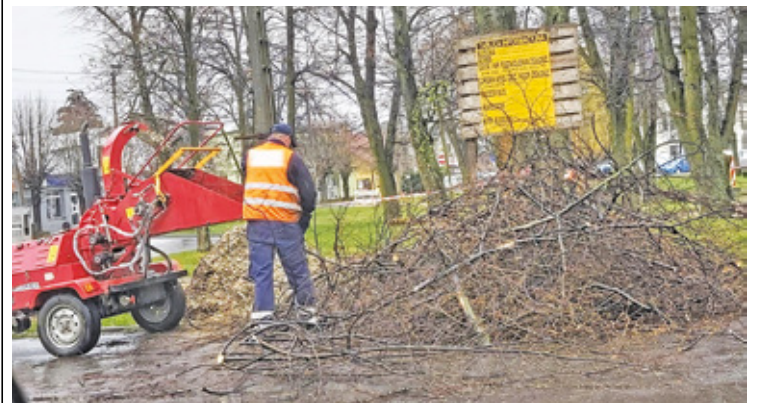
Skwer będzie gotowy pod koniec czerwca

Mieszkańcy, komentując przebudowę, zauważają potrzebę uzupełnienia miejsc rekreacji o instalacje służące zdrowiu, a wójt z nadzieją patrzy w przyszłość, mając nadzieję