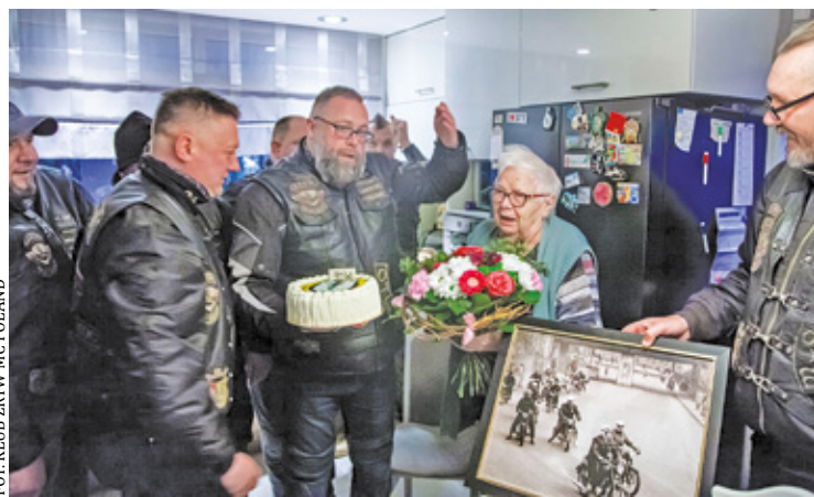
Niedawno najstarsza członkini klubu obchodziła 90. urodziny.

Najstarsza klubowiczka Zrywu, pod koniec marca obchodziła swoje 90. urodziny. Motocykliści pojechali do Babczy Zrywowej – bo tak na nią mówią motocykliści – z prezentami, kwiatami, tortem i czymś „na rozgrzanie”. – Nasza Babcia była członkinią Zrywu w latach 60., czyli wtedy, kiedy powstał nasz klub. Dlatego przy każdej możliwej okazji staramy się ją odwiedzać, a