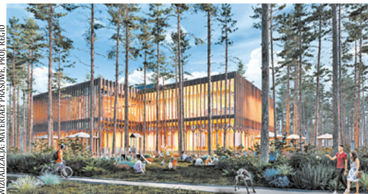
Obok nowoczesnego przedszkola powstanie piękna kulturoteka

zysków ciepła. Elewacja będzie wykonana deskowaniem oraz białą stolarką okienną i drzwiową, która nawiązuje do lokalnej zabudowy letniskowej – wyjaśnia rzeczniczka prasowa urzędu miasta.