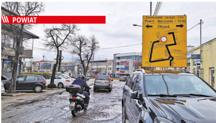
Drogowcy zamknęły skrzyżowanie przy poczcie i wyznaczyli objazdy