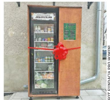
Społeczna lodówka stała przy ZGM przy ul. Wawerskiej 8 w Otwocku