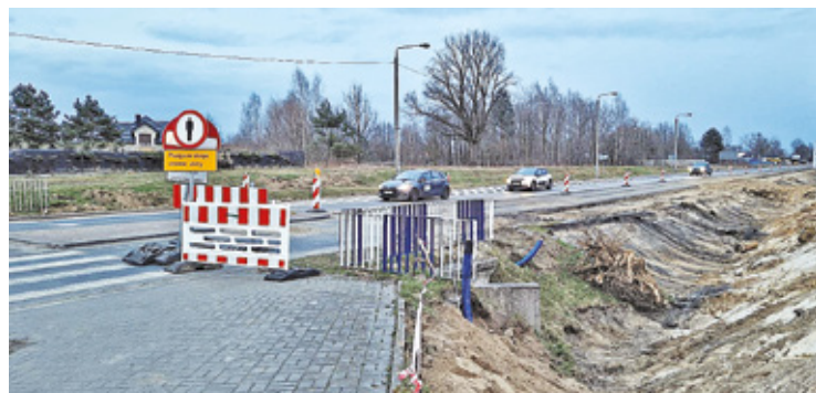
Budowa obwodnicy karczewskiej potrwa jeszcze 2 lata

Większość składów pojedzie zmienioną trasą. – Do piątku, 21 kwietnia dużo pociągów kursuje w skróconej relacji lub jest odwołana na odcinku Warszawa Wschodnia – Warszawa Za-