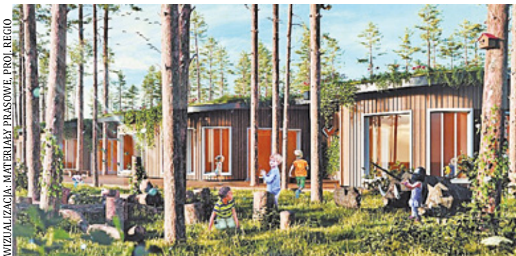
Dach przedszkola będzie pokryty roślinnością

Nowoczesny obiekt stanie na tyłach istniejącego placu zabaw przy ul. Asnyka, czyli kilkaset metrów od starego przedszkola. – Jeszcze w tym roku przy ul. Grottgera rozpocznie się budowa nowego przedszkola. Dzięki staraniom miasta inwestycja otrzymała dofinansowanie w wysokości 4 mln zł z Województwa Mazowieckiego – mówi Krystyna Olesińska, rzeczniczka prasowa Urzędu Miasta w Józefowie. Cała inwestycja ma kosztować około 10 mln zł.