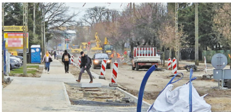
Na ul. Wawerskiej trwa budowa m.in. ronda i ścieżki rowerowej

Mieszkańcy powiatu otwockiego muszą uzbroić się w cierpliwość. W wielu miejscach już są prowadzone remonty lub właśnie się rozpoczynają. Kierowcy grzęzną w korkach, pociągi