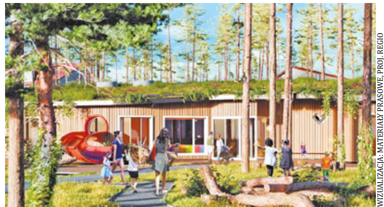
Nowa placówka powstanie w parterowym budynku

PROJ. REGIO