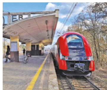
Utrudnienia w kursowaniu pociągów potrwają do 21 kwietnia

Przebudowa Warszawy Zachodniej wchodzi w kolejny etap. – Wykonawca postawił mur oporowy potrzebny do budowy łącznika między liniami warszawskiej średnicy dalekobieżnej i podmiejskiej. Łącznik umożliwi prze-