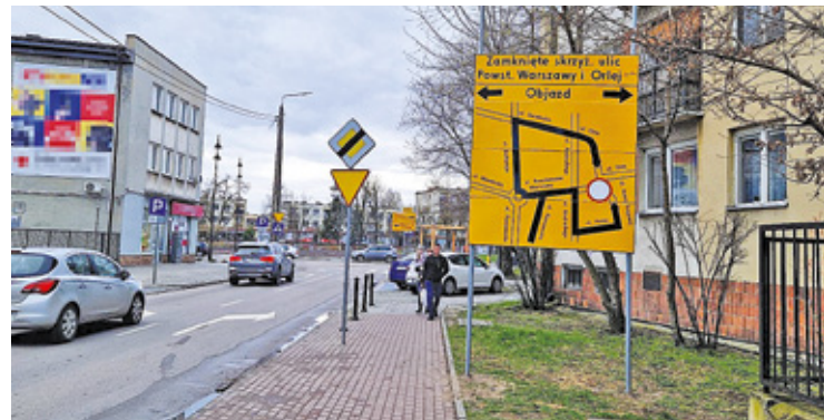
Centrum Otwocka najlepiej omijać szerokim łukiem m.in. ul. Batorego, ul. Karczewską i ul. Kołłątają

chodnia. Poza tym przez godzinę przez linię średnicową kursują 3 pociągi w kierunku wschodnim i 3 w kierunku zachodnim. Składy kursują w jedną stronę co 3-4 min. przez 10 min., potem jest ok. 50-minutowa przerwa – wyjaśniają Koleje Mazowieckie.