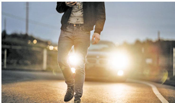
Sprawą zajęli się karczewscy policjanci. Sfrustrowanym kierowcą jeepa okazał się mieszkaniec Karczewa