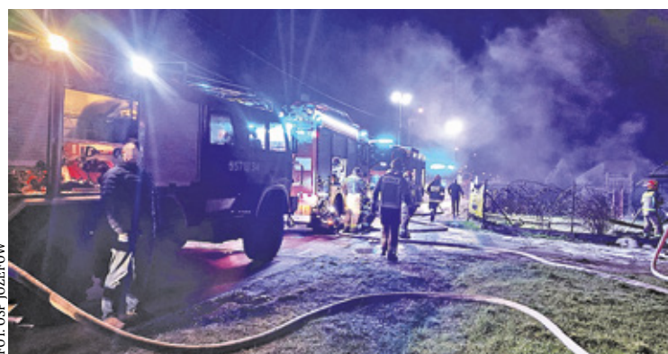
Strażacy walczyli z szalejącym ogniem w domu, gdzie była instalacja fotowoltaiczna

Z żywiołem walczyło ponad 40 strażaków. Akcja nie była łatwa, bo dostęp do źródła żywiołu, które znajdowało się na poddaszu, był utrudniony. Do tego panowała bardzo wysoka temperatura. – Na poddaszu znajdowało się urządzenie do przetwarzania energii w prąd stały, które trzeba było