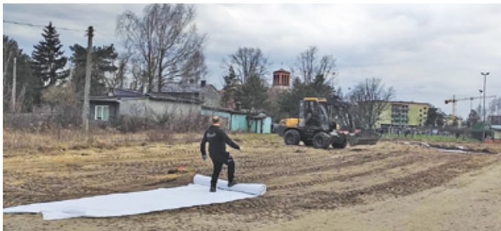
Kilka dni temu wykonawca rozpoczął już prace na terenie

Kolejny tor do ekstremalnej jazdy na rowerze czy rolkach powstanie na dużym osiedlu Ługi od strony osiedla