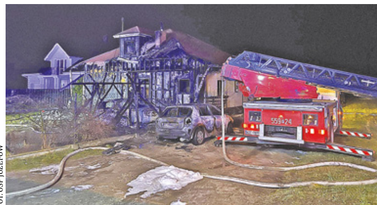
Ogień strawił część budynku, a także dwa zaparkowane obok samochody