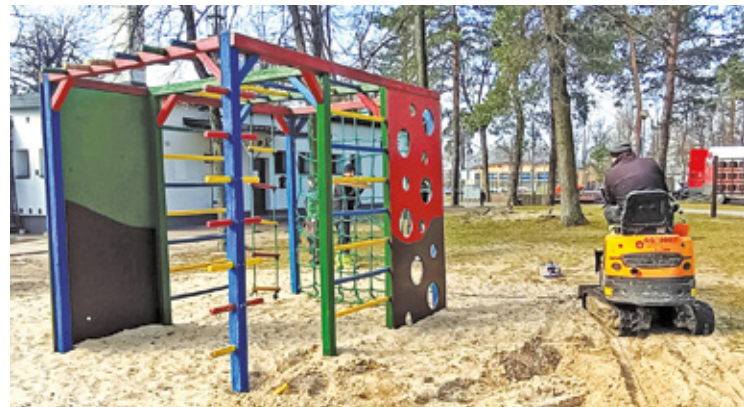
Modernizacja placu zabaw już się rozpoczęła. Urząd gminy prosi rodziców o ostrożność

Kilka dni temu rozpoczęto prace przygotowawcze do I etapu modernizacji placu zabaw, który znajduje się w centrum Celestynowa na rogu ul. Św. Kazimierza i ul. Reguckiej. Chodzi o budowę obiektów małej architektury w ramach doposażenia placu zabaw,