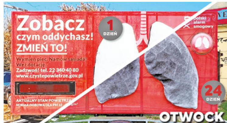
Mobilne płuca Polskiego Alarmu Smogowego unaoeczyli problem ze smogiem w Otwocku

Jest więc nad czym pracować. Wprawdzie tegoroczna zima nie dała się nam jakoś bardzo we znaki, jeśli chodzi o szczególnie niekorzystne wa-