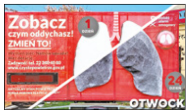
/// Otwock - Otwock w czołówce trucieli s. 6