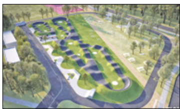
/// Otwock - Pumptrack na Ługach s. 2

CELESTYNÓW /// JÓZEFÓW /// KARCEW /// KOŁBIEL /// OSIECK /// OTWOCK /// SOBIENIE-JEZIORY /// WIĄZOWNA /// WAWER