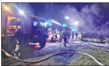
/// Celestynów - Pożar drewnianego domu s. 3