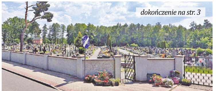
dokończenie na str. 3

P arafia w Celestynowie powstała w 1927 roku, kiedy wybudowano drewnianą kaplicę. Wtedy jeszcze nie było parafialnego cmentarza. Dlatego groby zmarłych z Celestynowa znajdują się w Karczewie i Kołbieli. W 1931 roku podczas porodu zmarła 29-let-