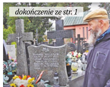
Liczba mieszkańców stale rośnie

Obecnie teren cmentarza jest już niewystarczający i zaczyna brakować