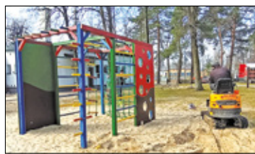
/// Celestynów - Stary plac zabaw jak nowy s. 4