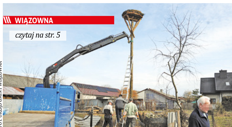
/// WIĄZOWNA czytaj na str. 5

Z pomocą bocianowi przyszli mieszkańcy Woli Karczewskiej i urzędnicy