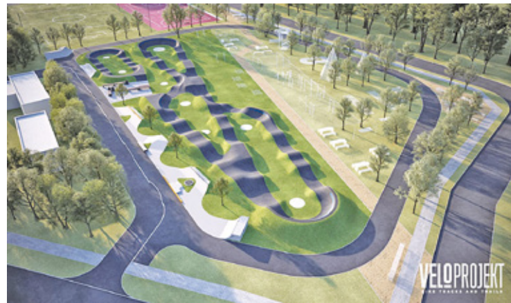
WIZUALIZACJA: MATERIAŁY WYKONAWCY

Lokalizacja również nie jest przypadkowa, bo stacja rekreacyjno-sportowa powstaje w okolicy ul. Ługi i ul. Danuty na dużym osiedlu mieszkalnym Ługi, gdzie niedaleko znajduje się drugie duże osiedle Morskie Oko. – To miejsce będzie cieszyło się dużą popularnością wśród mieszkańców osiedli i umożliwi spędzanie czasu w aktywnej