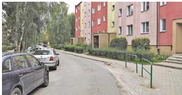
Sprawca zaatakował 20-latkę i jego koleżankę na osiedlu Ługi

– Kiedy 20-latek stanął w obronie koleżanki, agresywny mężczyzna złapał go za włosy, przewrócił na ziemię