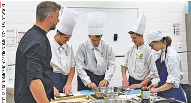
W „Ekonomiku” można uczyć się zawodu Technik żywienia i usług gastronomicznych

Technik ekonomista – oddział przygotowania wojskowego Technik rachunkowości