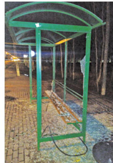
Sprawcy wybili wszystkie szyby