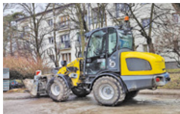
Na te inwestycje mieszkańcy czekają od kilku, a nawet kilkunastu lat