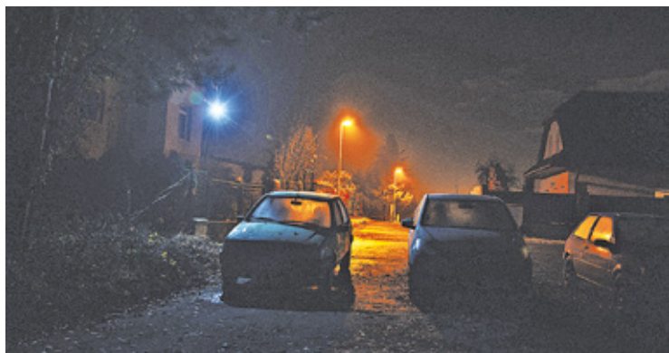
Wymieniają kilka tysięcy starych lamp ulicznych na nowoczesne, ledowe

– Wszystkie oprawy będą wyposażone w zasilacze z pełnym, cyfrowym sterowaniem czasu i mocy świecenia