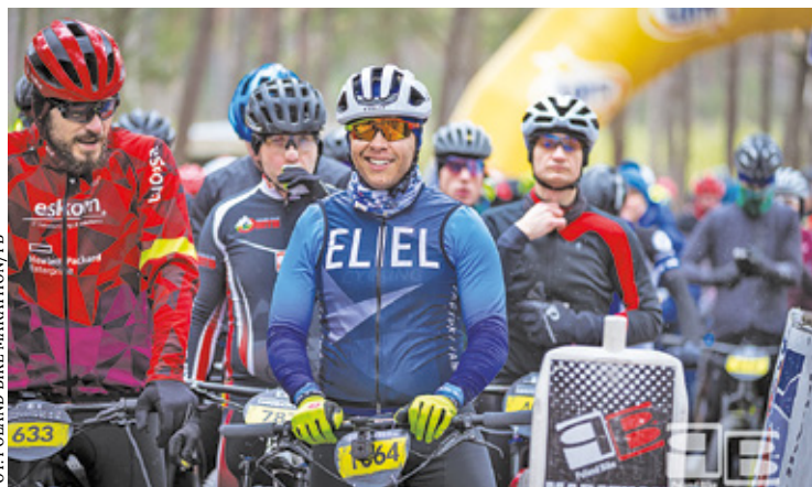
Zimowy Poland Bike Marathon w Otwocku

W tej odświeżonej kolarze wrócili na kultową otwocką trasę Poland Bike, którą cenią sobie amatorzy MTB. Cytując organizatorów: „Szlaki i dukty leśne w Mazowieckim Parku Krajobrazowym mają swój wyjątkowy urok. To teren jak na Mazowsze dość pofałdowany, pełen pięknych i zarazem technicznych odcinków”. Rywalizacja toczyła się na trzech dystansach: MAX (37 kilometrów), MINI (18,5 kilometra) oraz FAN (8 kilometrów). Ten ostatni dedykowany był uczniom szkół podstawowych. W zawodach prowadzono klasyfikację indywidualną, a także drużynową i rodzinną.