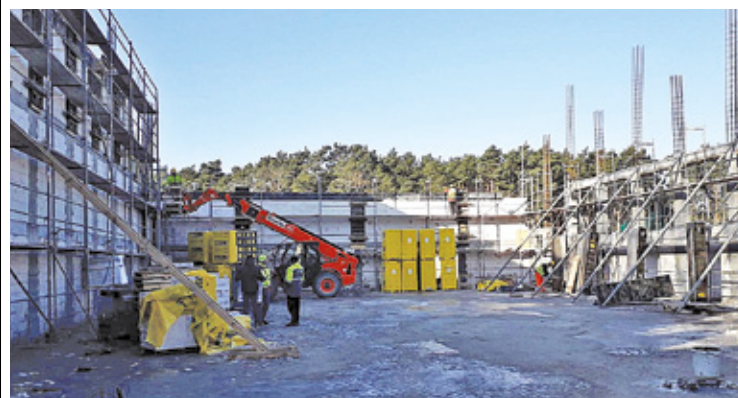
Uczniowie i rodzice z niecierpliwością czekają na nowoczesną salę sportową

Do czasu zakończenia budowy, uczniowie z „Dwójki” chodzą na lekcje WF do hali sportowej, która znajduje