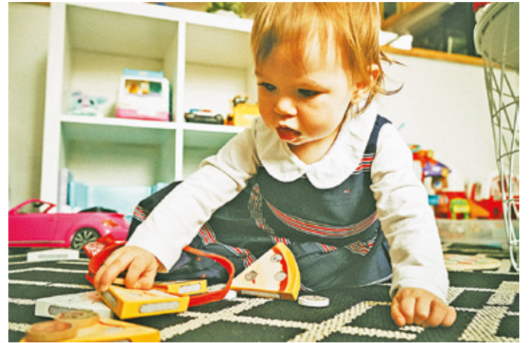
Niemal wszyscy respondenci chcą, aby powstał gminny żłobek

98 proc. respondentów stwierdziło, że jest zainteresowana korzystaniem z opieki w żłobku. 94 proc. osób stwierdziło, że jest zainteresowana opieką w gminnym żłobku, a nie prywatnej placówce. Niemal połowa respondentów (128) chciałaby zostawiać dziecko pod opieką w żłobku na czas