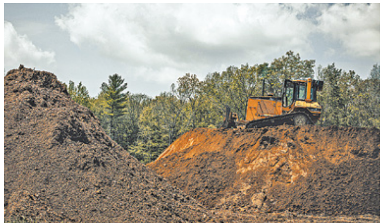
Młode drzewa wyrosły na terenach przemysłowych przeznaczonych pod budowę 3 i 4 kwatery na składowisku

W e wrześniu 2019 roku spółka Amest Otwock zwróciła się do prezydenta Otwocka z prośbą o zgodę na usunięcie młodych drzewek, które samoistnie wyrosły na terenach przemysłowych przeznaczonych pod budowę 3 i 4 kwatery na składowisku w Świerku. – Wobec braku wydania jakiegokolwiek postanowienia w tym zakresie w listopadzie 2020 roku złożyliśmy pozew sądowy dotyczący wydania zastępczej zgody na usunięcie drzew – wyjaśnia Mateusz Patoła z biura prasowego Amest Otwock. W marcu 2022 roku Sąd Okręgowy w Warszawie orzekł na korzyść spółki, wskazując, że