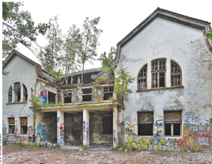
Fragment szpitala Zofiówka w Otwocku

Z bliżająca się wojna i zamieszki antyżydowskie w Polsce wytworzyły klimat strachu i represji. W przedwojennej prasie odszukałam wiadomości, które są przykładem koszmarnej atmosfery politycznej w Otwocku przed wybuchem wojny dotyczące szpitala Zofiówka.