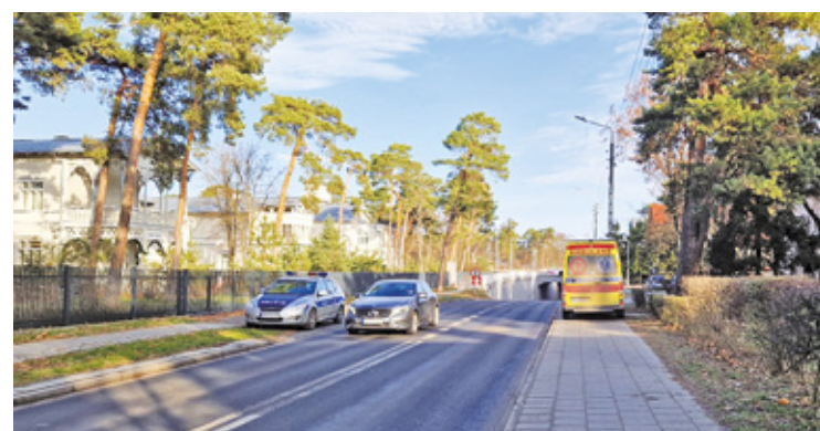
Jednym z doraźnych miejsc są tunele – między innymi ten na ulicy Żeromskiego i ulicy Majowej w Otwocku

cy nie mają gdzie się schować przed zagrożeniem.