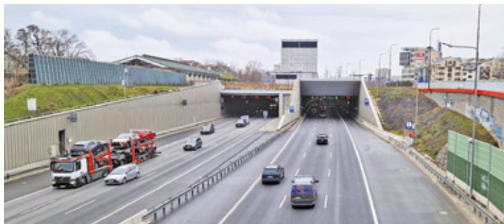
Dobrym miejscem na ukrycie się jest także tunel na trasie S2 w Wawrze. Jednak nie każdy z mieszkańców powiatu otwockiego będzie mógł tam dotrzeć

schrony mogą posłużyć także obiekty militarne z czasów wojny, zlokalizowane na terenie Józefowa i w okolicach Otwocka, m.in. schrony Regelbau 120a i Regelbau 514 na Dąbrowieckiej Górze (gmina Celestynów). Stanowią one elementy fortyfikacji i umocnień Przedmościa Warszawskiego. Kolejny schron znajduje się na terenie Instytutu Łączności w Miedzeszynie. I... na tym koniec. Nie oznacza to, że w razie sytuacji kryzysowej mieszkań-