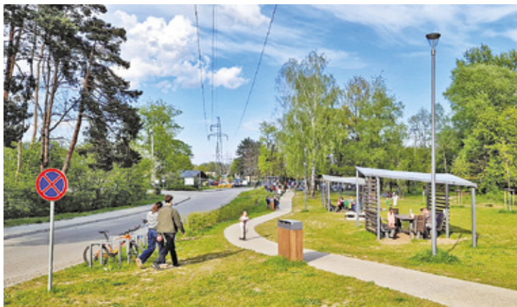
Ogłoszono przetarg na dzierżawę terenów w kompleksie rekreacyjnym nad rzeką

pumptrack. W związku z nadchodzącym sezonem letnim, miasto Józefów planuje ożywić tę część plaży. Dlatego niedawno ogłoszono przetarg na dzierżawę terenów w kompleksie rekreacyjnym, z dogodnym wjazdem od ul. Wawerskiej, tuż przy parku i moście dawnej kolejki wąskotorowej.