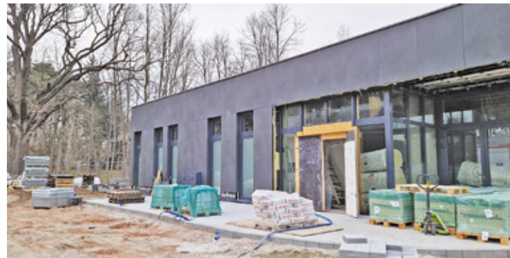
Za targowiskiem powstała nowa przychodnia zdrowia

W nowym ośrodku zdrowia będą trzy strefy przeznaczone dla różnych grup pacjentów. Strefa dla dorosłych obejmuje gabinety lekarzy rodzinnych, ginekologa, położnej, stomatologa, gabinet zabiegowy, pracownię EKG oraz pokój dla pielęgniarki środowiskowej. Strefa dla dzieci chorych zawiera gabinet pediatry oraz specjalny pokój dla