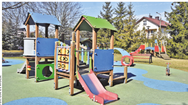
Miejski żłobek przy ul. Wroniej zyska nowoczesną przestrzeń do zabawy dla dzieci

Miejski żłobek przy ul. Wroniej od wielu lat zapewnia opiekę ponad 100 dzieciom w wieku do 3 lat. Jeszcze w tym roku plac zabaw na terenie żłobka przejdzie modernizację. – Powstaną tam nowoczesne strefy aktywności, dostosowane do potrzeb najmłodszych dzieci. Wśród nowych atrakcji znajdują się strefa relaksu, kuchnie błotne, zielone przystanki oraz ścieżka sensoryczna – informuje Urząd Miasta Otwock.