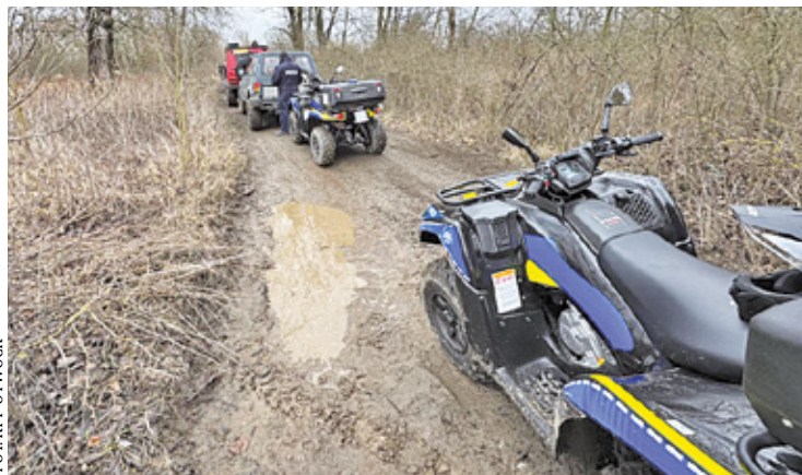
Nowy sprzęt jest intensywnie wykorzystywany do patrolowania terenów zaliczanych jako rezerваты przyrody oraz licznych terenów zielonych na terenie gminy Karczew

– Nowy sprzęt jest już od kilku tygodni intensywnie wykorzystywany do patrolowania terenów zaliczanych jako rezerваты przyrody oraz licznych terenów zielonych m.in. na terenie gminy Karczew. Mowa między innymi o terenach nadwiślańskich w ramach Obszaru Chronionego Natura 2000, Rezerwatu Łąki Ostrówieckie, czy też obszarach w ramach Mazowieckiego Zespołu Parków Krajobrazowych -