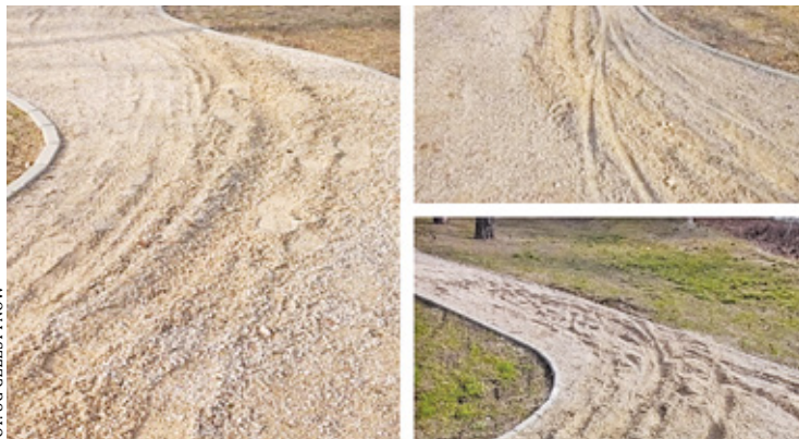
Gmina do wpisu dołączyła zdjęcia, na których widoczne są wgłębienia w powierzchni

Informujemy, iż posiadamy nagrania i zdjęcia sprawców. W przypadku braku zgłoszenia sprawa zostanie skierowana na policję - dodano w mediach społecznościowych.