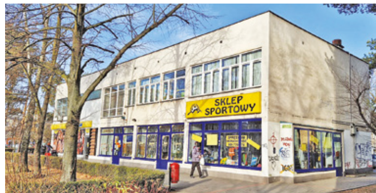
Niedawno zlikwidowano jeden z najstarszych sklepów w Otwocku

czy rocznice. To była jedna z nielicznych kwiaciarni, gdzie wówczas można było kupić kwiaty także w weekend. Z cza-