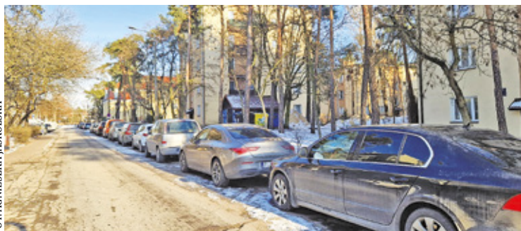
Znalezienie miejsca parkingowego przy ul. Hożej i urzędzie miasta nie jest łatwe

Miasto planuje także zwiększyć liczbę miejsc parkingowych przy urzędzie, ale wiele zależy od rozmów na temat wydzierżawienia od PKP PLK terenu wzdłuż ul. Armii Krajowej, na