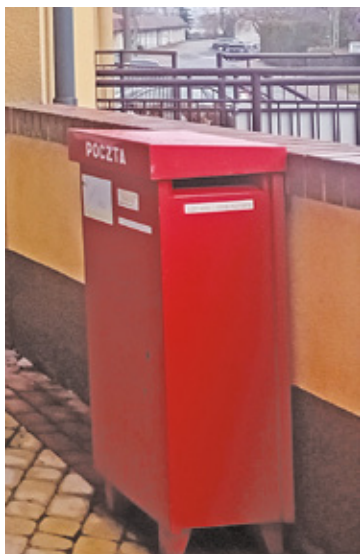
Zmiany organizacyjne są konieczne

– Planowane są w odniesieniu do placówki pocztowej w miejscowości Sobienie-Jeziory zmiany o charakterze wyłącznie organizacyjnym (wewnętrznym), które nie będą miały wpływu na katalog usług, jakość ich świadczenia, jak również proces obsługi klientów – zapewnia Poczta Polska.