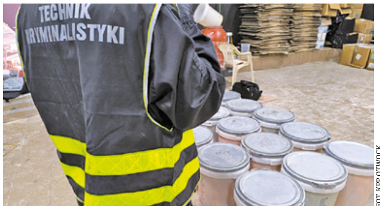
Sprawcy działali na szeroką skalę

W ostatnim czasie funkcjonariusze namierzali źródło nielegalnych substancji. Na jednej z posesji w Otwocku funkcjonowała nielegalna produkcja farmaceutyków. Interes dobrze się kręcił i to na szeroką skalę.