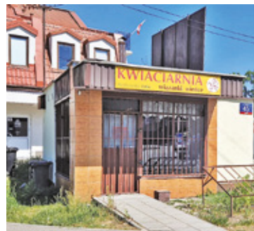
Mały budynek, w którym kiedyś była kwiaciarnia, został zburzony

Mały budynek przy ul. Reymonta 45 w Otwocku przez dekady wpisał się w krajobraz miasta. Tu przez wiele lat mieszkańcy kupowali kwiaty i wianki na śluby, urodziny, imieniny,