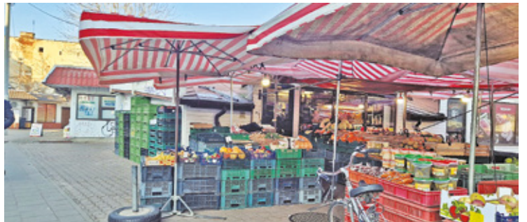
Niektórzy kupcy przenieśli swój biznes lub go zamknęli, ale część wciąż handluje

Władze Otwocka od dawna planują uporządkować zaniedbany fragment centrum, gdzie ponad 30 lat temu powstało tymczasowe targowisko. Miało ono funkcjonować jedynie do czasu wybudowania nowego bazaru, jednak do realizacji tych planów nie doszło. Okazało się jednak, że lokalizacja targowiska przypadła mieszkań-