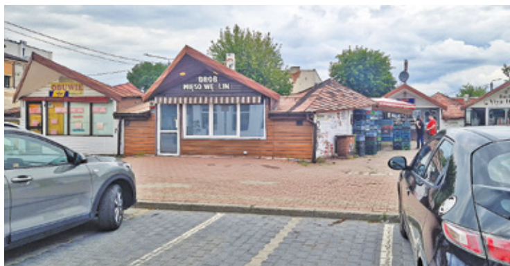
Stary bazarek zostanie zrównany z ziemią

tuj i buduj”. Po jego wyborze zostanie podpisana umowa na opracowanie kompletnej dokumentacji projektowej, uzyskanie pozwolenia na budowę oraz realizację inwestycji – wyjaśnia otwockie biuro prasowe. – Terminy umowne przewidują sześć miesięcy na opracowanie dokumentacji projektowej wraz