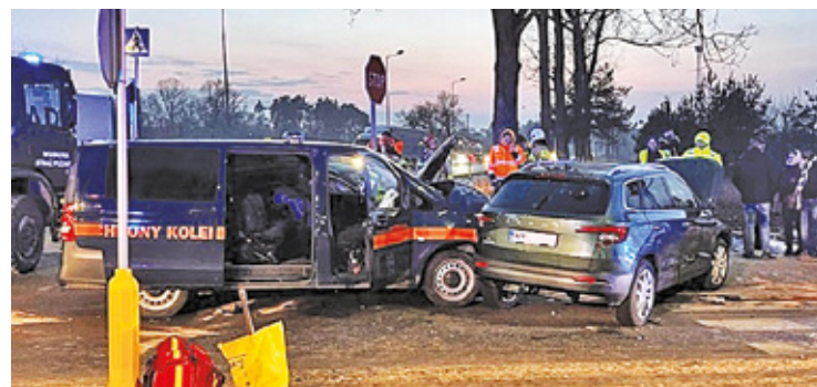
Kierowca Straży Ochrony Kolei jechał drogą nr 50, jako pojazd uprzywilejowany

– Ze wstępnych ustaleń policji wynika, że 38-letni kierowca samochodu Straży Ochrony Kolei poruszał się jako pojazd uprzywilejowany, czyli na sygnałach dźwiękowych i świetlnych, drogą krajową nr 50 w kierunku Pio-