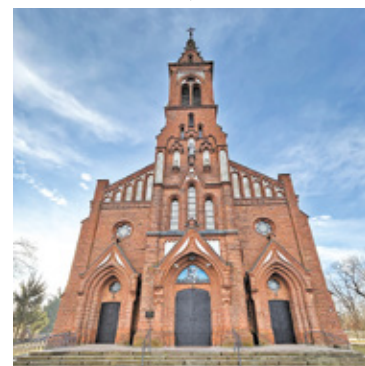
FOT. AGNIESZKA DEJA

Kościół Świętej Trójcy w Kołbiewie powstał w latach 1895-1902. Charakterystycznym elementem budowli jest 50-metrowa wieża, pełniąca funkcję dzwonnicy. W środku znajdują się trzy dzwony o imionach Józef, Maryja i Antoni-Franciszek-Wojciech. Główny ołtarz w kościele pochodzi z XVII wieku. Budynek niebawem przejdzie konserwację. Parafia pozyskała dofinansowanie na kontynuację rozpoczętych kilka lat temu prac. Tym razem w ramach programu Ochrona zabytków z Ministerstwa Kultury i Dziedzictwa Narodowego parafia otrzymała 400 tys. zł. Środki te przeznaczone zostaną na konserwację lica muru elewacji wieży, renowację detalu iglicy wieży oraz konserwację 3 rzeźb.