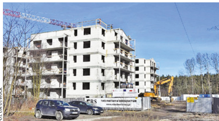
Budynki wielorodzinne powstają na osiedlu Ługi

Margielski. Dlatego lista oczekujących na przydział mieszkań w budynkach komunalnych i socjalnych od wielu lat jest długa. Część z tych osób zamieszka w nowych lokalach. Kilka dni temu informowaliśmy o tym, że do nowych budynków komunalnych przy ul. Kochanowskiego wprowadzają się już pierwsi lokatorzy. Pod naszym artykułem rozgorzała dyskusja na temat przydziału miejskich lokali.