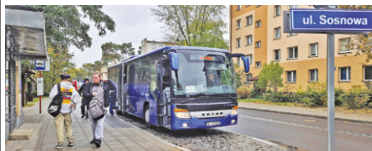
Lokalne linie nadal będą kursowały po gminie Celestynów i sąsiednich gminach

– Dzięki porozumieniu z gminą Kołbiel, uruchomiona została linia K3, która kursuje na trasie: Celestynów – Gózd – Kołbiel. Linia ta jest również