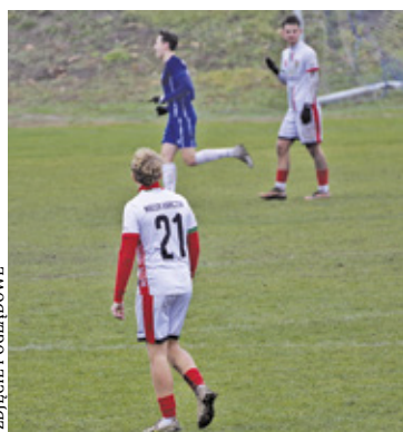
Mazur Karczew to aktualny lider Decathlon V Ligi