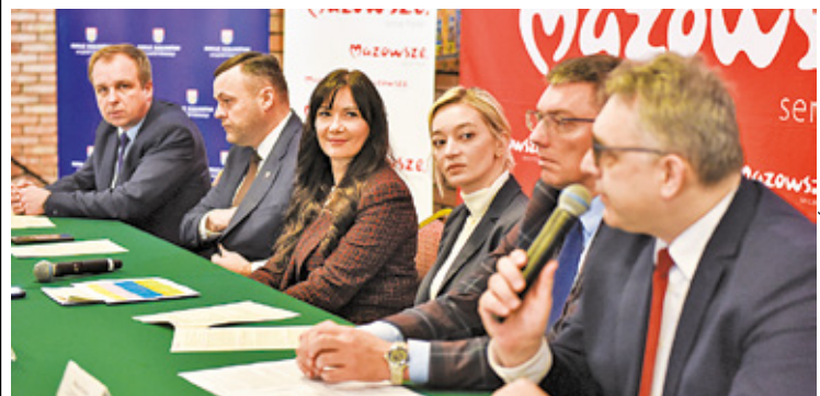
Mazowsze przeznaczyło na inwestycje w regionie warszawskim wschodnim samorząd województwa przeznaczył ponad 266 mln zł

– Mazowieckie Centrum Leczenia Chorób Płuc i Gruźlicy w Otwocku otrzyma w tym roku ponad 495 tys. zł na przygotowanie dokumentacji rozbudowy pawilonu A. Z kolei Mazowieckie Centrum Neuropsychiatrii w Zagórz w gminie Wiązowna planuje rozpoczęcie budowy oddziału psychiatrycznego dla dzieci wraz ze szkołą przyszpitalną. Na ten cel samorząd województwa zarezerwował do 2027 r. ponad 188 mln