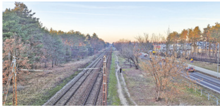
W tym miejscu powstanie ciąg pieszo-rowerowy pod torami