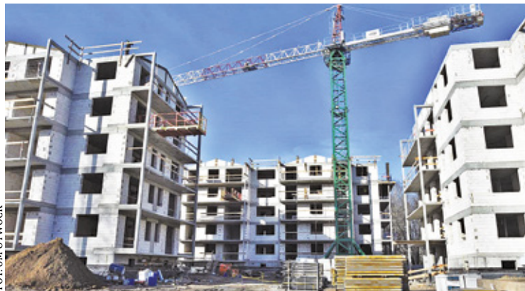
Miasto buduje nowe bloki komunalne z windą

B udowa budynków komunalnych to w ostatnich latach jeden z kluczowych projektów realizowanych przez władze Otwocka. Lokale są własnością miasta i nie mają wysokiego standardu, ale przyciągają mieszkańców niskimi opłatami za wynajem – są przeznaczone m.in. dla osób, które znalazły się w trudnej sytuacji życiowej. – Po latach stagnacji powiększamy sukcesywnie zasób mieszkaniowy miasta dla najbardziej potrzebujących rodzin – podkreśla prezydent Otwocka Jarosław