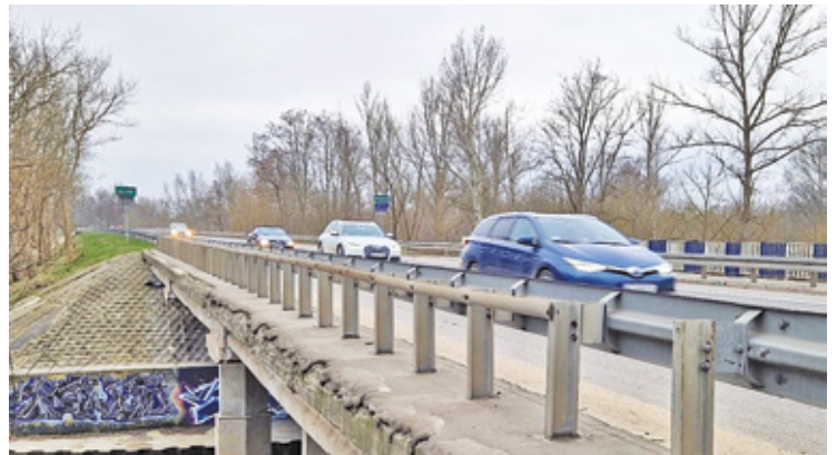
Na trasie 801 na wysokości Otwocka powstanie nowy most

W ubiegłym roku drogowcy wybudowali dwa nowe mosty w Otwocku, na odcinku pomiędzy Karczewem a Józefowem.