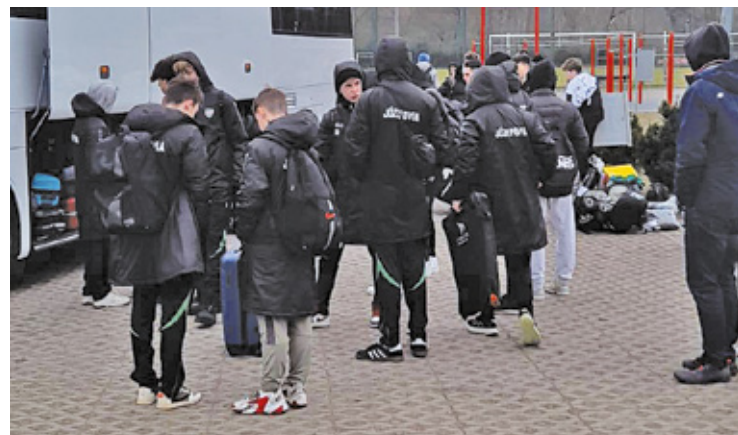
Józefovia przygotowuje się do ligi we Wrocławiu

Następna potyczka Wiązowny już w sobotę – o godzinie 17:00 w Mińsku Mazowieckim 3. ekipa ligi okręgowej spróbuje pokonać Mazovię II Mińsk Mazowiecki, lidera Komnet Ligi Okręgowej.