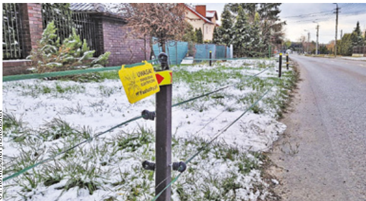
Tak niektórzy mieszkańcy Otwocka bronią swoich trawników przed dzikami

Obecnie trwa gorąca dyskusja na temat decyzji otwockiego starosty, który pod koniec 2024 roku – na wniosek prezydenta Otwocka – wydał nakaz przeprowadzenia odstrzału 80 dzików na terenie Otwocka. Miasto wskazało tereny, na których miał zostać przeprowadzony odstrzał. Obszar ten obejmował ulice: Generalską, Hallera, Ługi, Danuty, Lelewela, Słowackiego oraz okolice Turystycznej, Komunardów i rzeki Świder (poza rezerwatem). Dodatkowo wskazano tereny pomiędzy ulicami Żurawią i Majową a rzeką (od ul. Sienkiewicza do ul. Kreciej), a także rejon ulic: Armii Krajowej, Pułaskiego, Poniatowskiego, Narutowicza, oraz Grunwaldzkiej, Wyszyńskiego, Żeromskiego i Jałowcowej. Odstrzał miała przeprowadzić firma z Warsza-