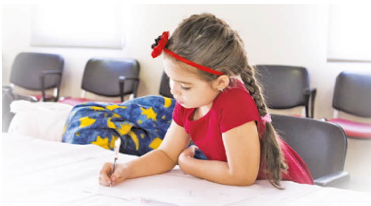
W lutym rozpoczyna się rekrutacja przedszkolaków i 7-laków w Otwocku

Wniosek o przyjęcie dziecka można wypełnić online, wydrukować, podpisać i złożyć w placówce pierwszego wyboru. – Jeśli nie ma takiej możliwości, należy pobrać druk wniosku w dowolnym przedszkolu lub szkole, wypełnić go ręcznie, podpisać i złożyć wraz z wymaganymi dokumentami w placówce pierwszego wyboru – wyjaśnia otwocki ratusz. I dodaje, że we wniosku rodzice lub opiekunowie wskazują maksymalnie 3 przedszkola, lub szkoły z oddziałami przedszkolnymi, uporządkowane od najbardziej do najmniej preferowanego. – Placówka pierwszego wyboru to ta, która znajduje się na pierwszej pozycji we wniosku. Przydział dzieci do oddziałów przedszkolnych nastąpi po zakończeniu rekrutacji, a organizacja oddziałów będzie zależna od liczby i wieku dzieci przyjętych do placówek – podkreśla Urząd Miasta w Otwocku.