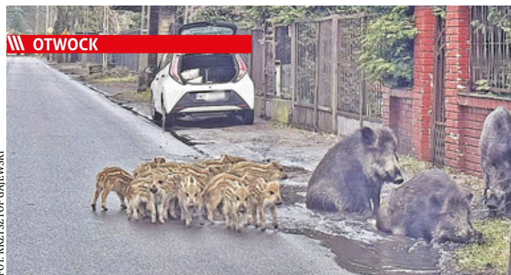
Dziki w miastach czują się jak w domu. Spacerują po ulicach m.in. Otwocka, Józefowa i Wawra

/// Powiat - Miliony na szpitalu, szkołę i drogi s. 7