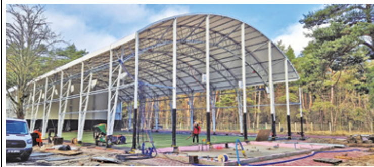
Zdjęcie z czasu realizacji inwestycji w otwockiej „Dwójce”

Podobne hale łukowe zostaną wybudowane również przy szkołach podstawowych nr 1, 4, 5, 6, 9 i 12. – Prace budowlane rozpoczęły się już na terenach szkół nr 4 i 12. Obecnie trwają prace nad opracowaniem projektów oraz uzyskaniem pozwoleń na budowę zadaszeń boisk w szkołach nr 1, 5, 6 i 9 – wylicza prezydent miasta.