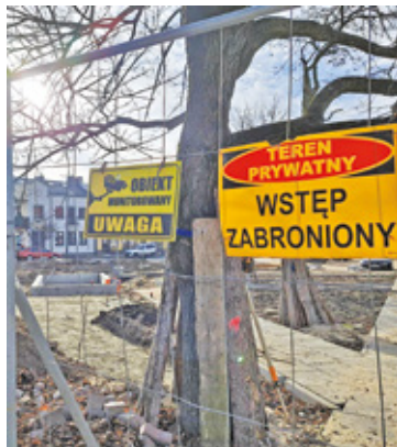
Zakończenie prac planowane jest w wakacje 2025 roku

– W ostatnim czasie została ułożona warstwa ścierna asfaltu na ul. Rynek Zygmunta Starego. Aktualnie trwają zaawansowane prace brukarskie na skwerze przy budynku OSP, a także przy Pomniku Orła Białego. Kończymy również prace związane z budową podświetlanych wodotrysków na posadzce granitowej na skwerze Wandy Bromińskiej. Wykonując zalecenia Mazowieckiego Konserwatora Zabytków, wykonaliśmy opaski brukowe wokół Orła Białego, pomnika Ochotników i krzyża. Bruk został odzyskany pod-