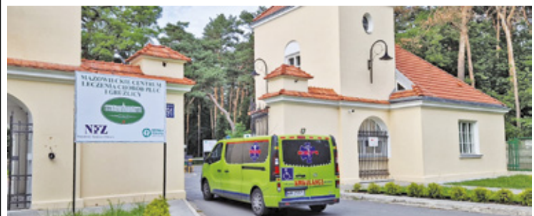
Mazowieckie Centrum Leczenia Chorób Płuc i Gruźlicy w Otwocku otrzyma około 0,5 mln zł na rozbudowę pawilonu A

„Wybór propozycji projektów strategicznych w zakresie dofinansowania zadań, polegających na budowie, przebudowie, modernizacji lub doposażeniu infrastruktury strategicznej podmiotów wykonujących działalność leczniczą w rodzaju stacjonarne i całodobowe świadczenia zdrowotne w zakresie opieka psychiatryczna i lecze-