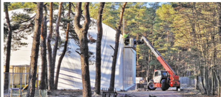
Pierwsza hala łukowa powstała w SP nr 2 w Otwocku Śródborowie

że wyposażona w zaplecze sanitarno-szatniowe oraz mobilną strzelnicę laserową – podkreśla prezydent Otwocka Jarosław Margielski. I podkreśla, że jest