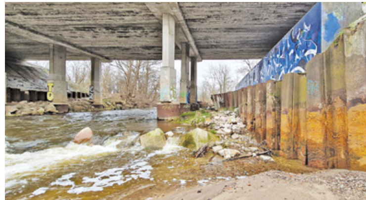
Nowy obiekt nad rzeką będzie szerszy niż stary most

Mazowiecki Zarząd Dróg Wojewódzkich w Warszawie rozpoczyna budowę kolejnego, trzeciego mostu. Tym razem chodzi o przeprawę na rzece Świder, pomiędzy Otwockiem a Józefowem, zlokalizowaną kilkaset metrów od dwóch nowych mostów (na