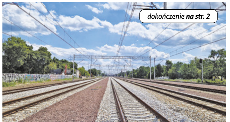
Nowe tory przy PKP Wawer

K olej przygotowuje się do ostatniego etapu modernizacji linii kolejowej nr 7 w naszych okolicach. Chodzi o odcinek Wawer – Otwock, gdzie powstaną m.in. cztery tory. To wiąże się z wycinką kilkunastu tysięcy drzew i krzewów oraz rozbiórką 11 obiektów.