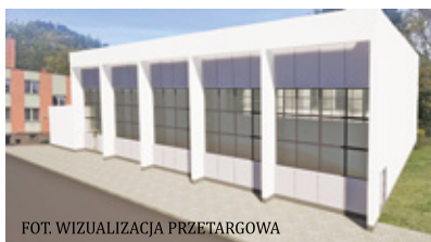
FOT. WIZUALIZACJA PRZETARGOWA

– Inwestycja będzie realizowana w ramach programu „Olimpia” Ministerstwa Sportu i Turystyki, czyli budowy przyszkolnych hal sportowych na 100-lecie pierwszych występów reprezentacji Polski na Igrzyskach Olimpijskich – dodaje gmina.