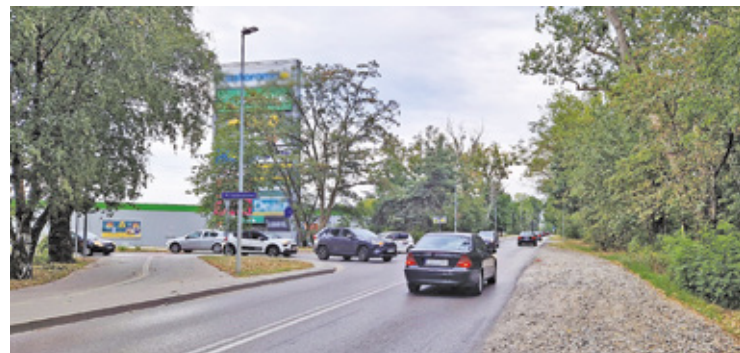
Drogowcy dwa razy zmieniali koncepcję na przebudowę skrzyżowania na ul. Kraszewskiego i ul. Kuklińskiego

Na ul. Kraszewskiego w Otwocku, zwłaszcza na wysokości skrzyżowania do centrum handlowego i osiedla mieszkaniowych, często tworzą się korki. Miał być lewoskręt, ale go jednak nie będzie!