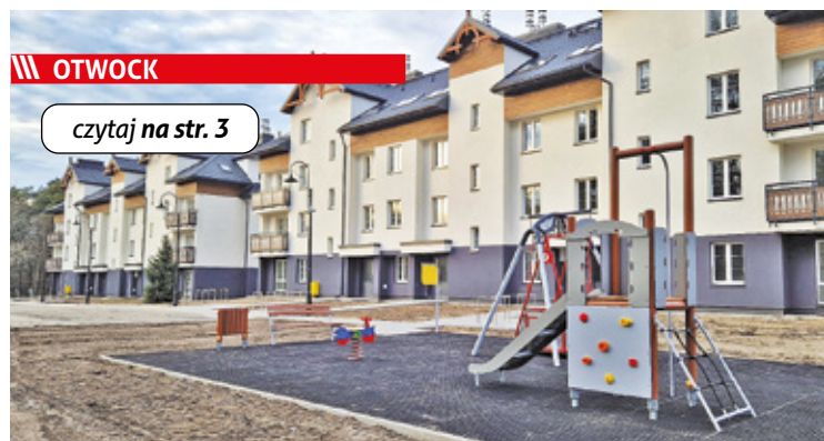
Budowa dwóch budynków komunalnych trwała ponad dwa lata

/// Kołbiel - Rzeka nie podlega już ochronie? s. 7