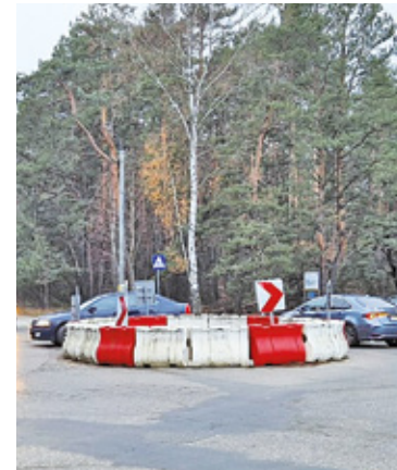
Na skrzyżowaniu ul. Narutowicza i ul. Armii Krajowej od lat stoi „plastikowe rondo”.