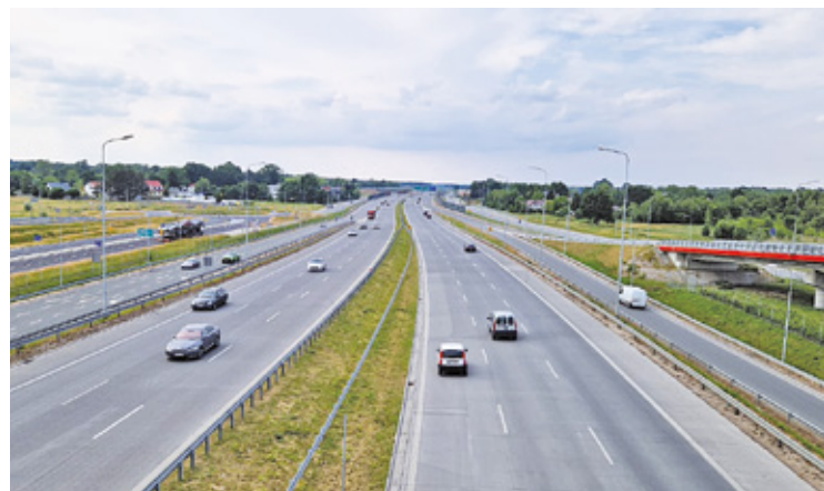
Urząd Marszałkowski nakazał GDDKiA wykonanie dodatkowych ekranów przy trasie S17

– Są to uzupełnienia ekranów wskazanych w analizie porealizacyjnej, przeprowadzonej przez GDDKiA – wyjaśnia urząd gminy. I dodaje: – Marszałek uwzględnił także pomiary hałasu wykonane na zlecenie miasta Otwocka